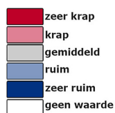
Afbeelding 3: Spanningsindicator Nederland 2e kwartaal 2020